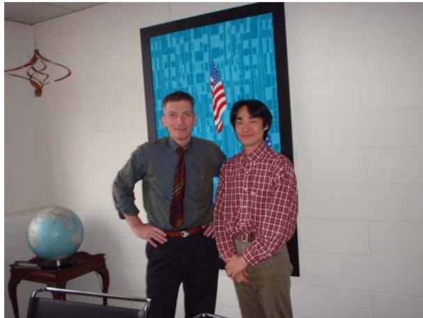
写真2 MIT Sadoway 教授 (左) と筆者 (右)