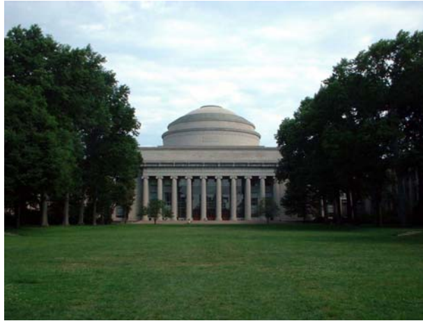
写真1 MIT のメインビルディング